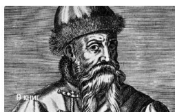
Иоганн Гутенберг Первый типограф Европы